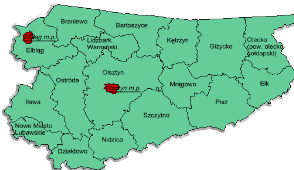
Rys.2 Usytuowanie powiatu działdowskiego na tle województwa warmińsko-mazurskiego

Gmina Iłowo-Osada jest gminą wiejską położoną w południowej części województwa warmińsko-mazurskiego, w powiecie działdowskim. Bezpośrednio graniczy ona z gminami Warmii i Mazur: Działdowem (gminą powiatu działdowskiego), Kozłowem i Janowcem Kościelnym (gminami powiatu nidzickiego) oraz Mazowsza: Mławą oraz Wieczfnią Kościelną i Lipowcem Kościelnym (gminami powiatu mławskiego)