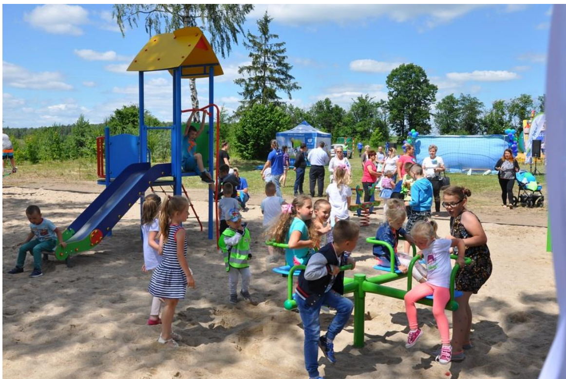
Rys. 11 Plac zabaw w Białutach