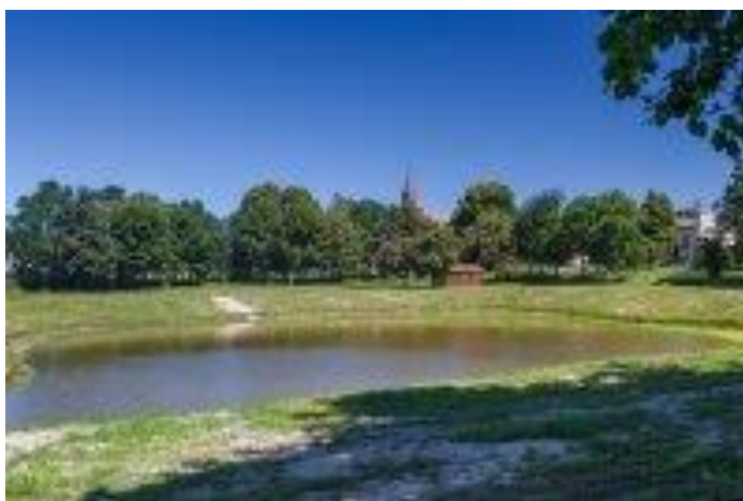
Rys.13 Centrum wsi Białuty

W oparciu o powyższe obiekty i infrastrukturę sportowo-rekreacyjną organizowane są przedsięwzięcia kulturalne, sportowe mające na celu integrację mieszkańców wsi.