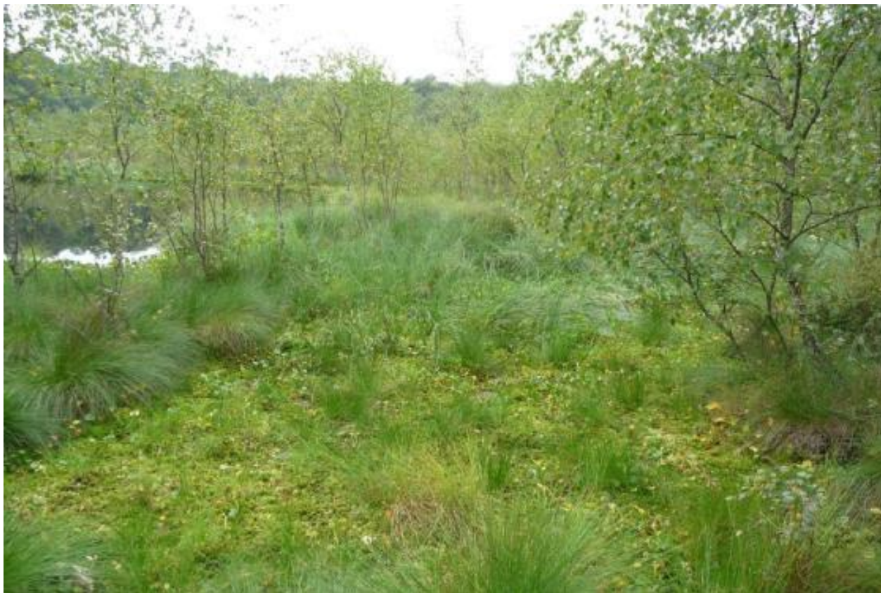
Rys. 12. Rezerwat "Świńskie Bagno"

Do zasobów przyrodniczych sołectwa należy również rzeka Mławka wypływająca ze zbiornika wodnego.