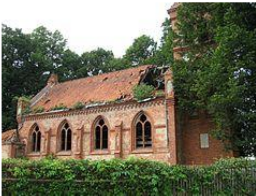
Rys.6 Ruiny neogotyckiego kościoła ewangelickiego