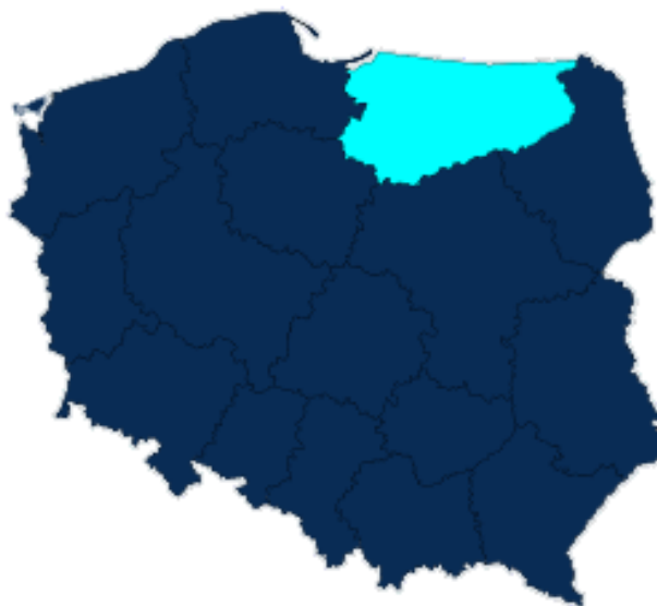
Rys.1 Usytuowanie województwa warmińsko-mazurskiego na tle kraju

działdowskim, w województwie warmińsko –mazurskim. Współrzędne geograficzne miejscowości to 53°12' szerokości geograficznej północnej i 20°23' długości geograficznej wschodniej.