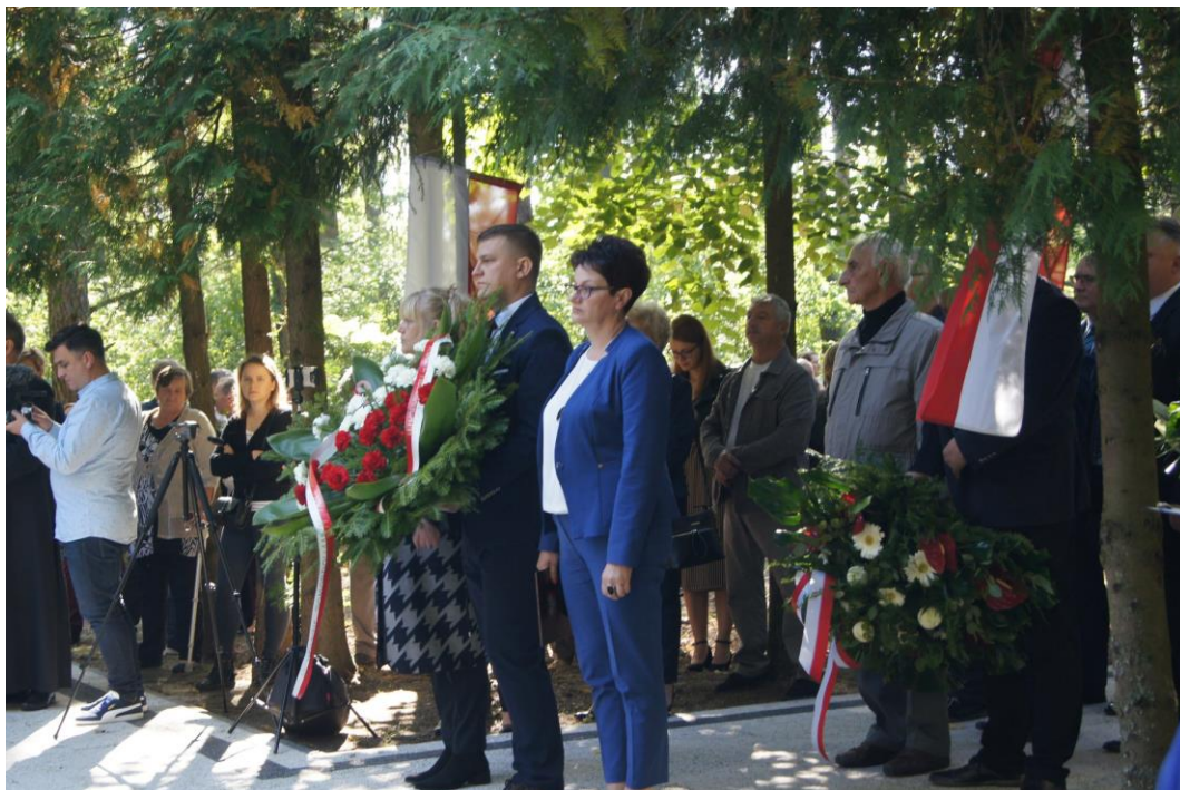
Rys.7 Obchody patriotyczne przy pomniku poświęconym „Ofiarom Hitlerowskich Zbrodni”