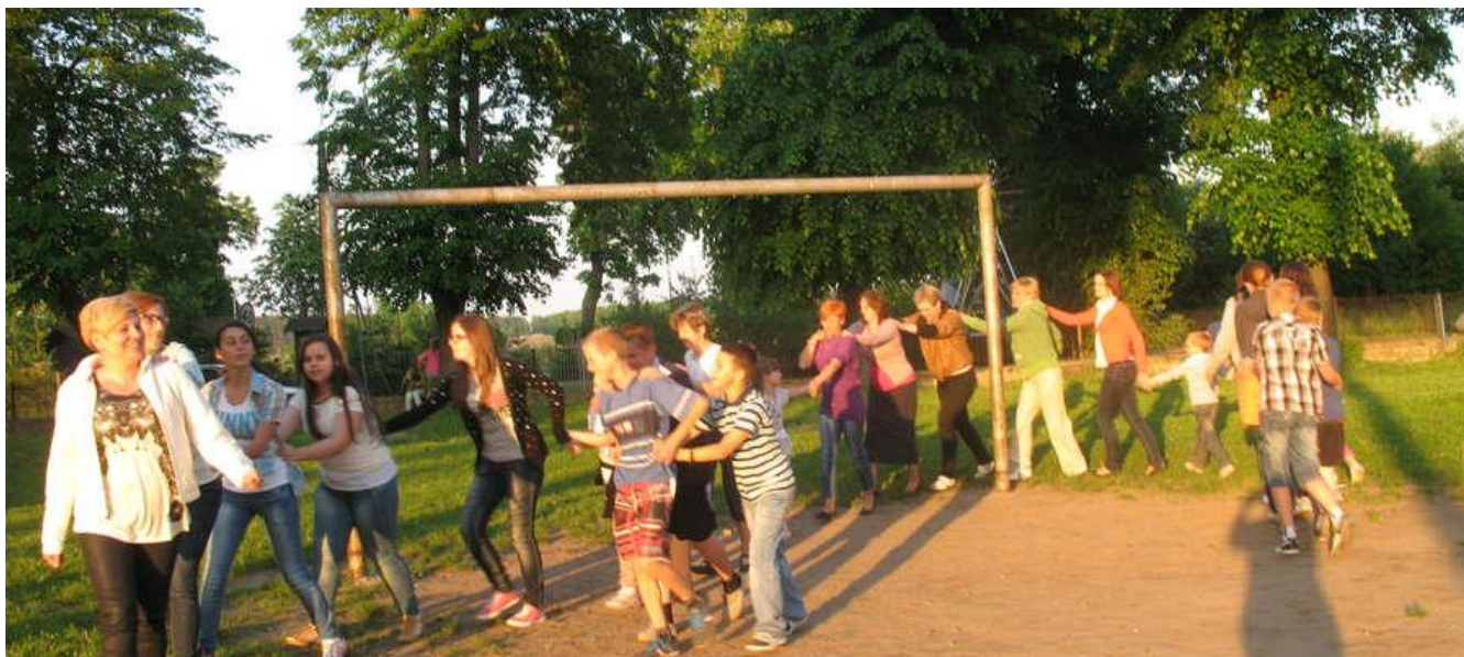
Rys.8 Integracja rodzinna we wsi Białuty

- spotkania rodzinne z okazji świąt i wydarzeń okolicznościowych.